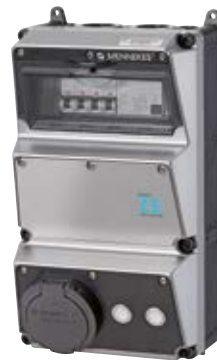
MENNEKES Z.E. Wallbox plus 11