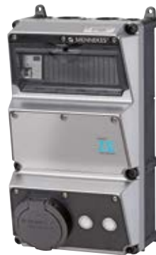
MENNEKES Z.E. Wallbox plus 3,7