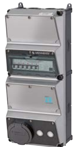
MENNEKES Z.E. Wallbox plus 22